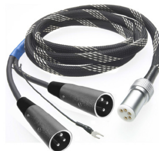
Connect it Phono DS 5P/XLR: separat erhältliches Upgrade-Kabel für True Balanced Phono-Verbindungen