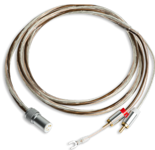
Inkl. Connect it Phono E 5P/RCA: Semi-symmetrisches Premium Phonokabel